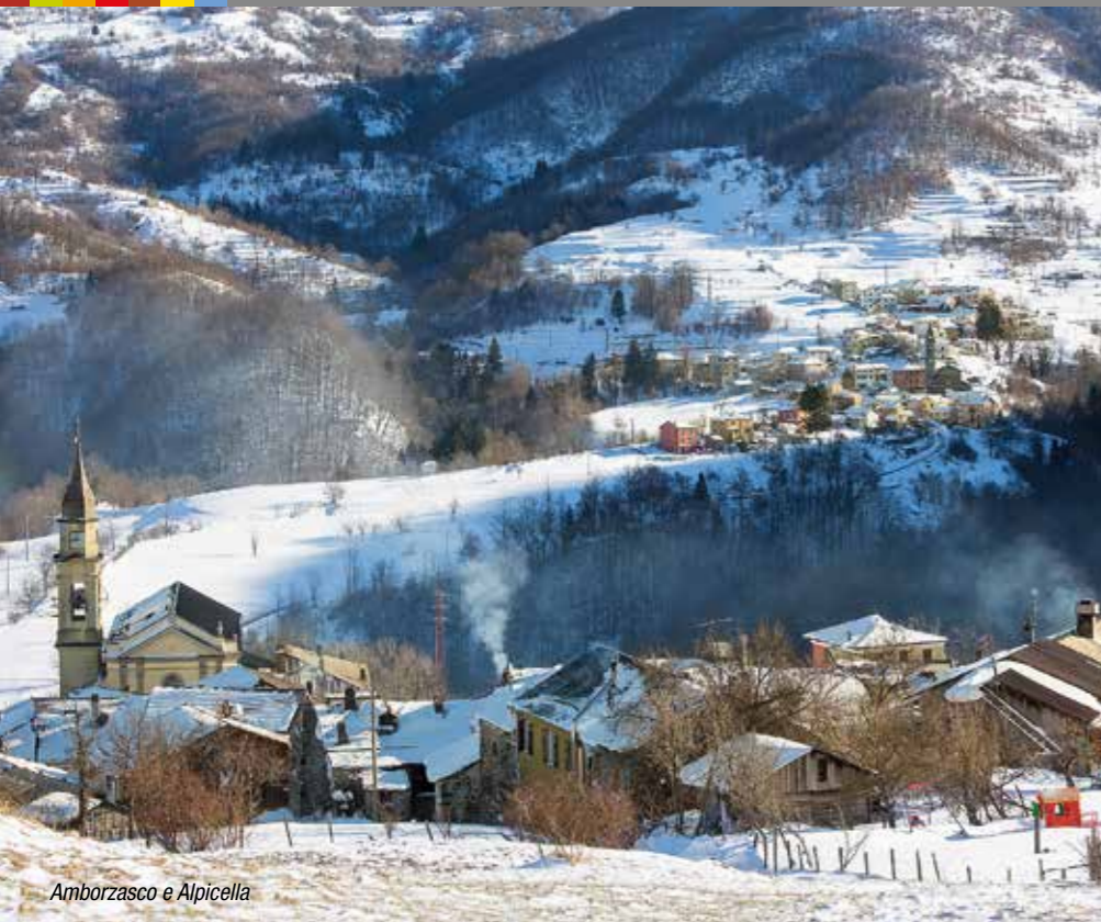
Amorzasco e Alpicella