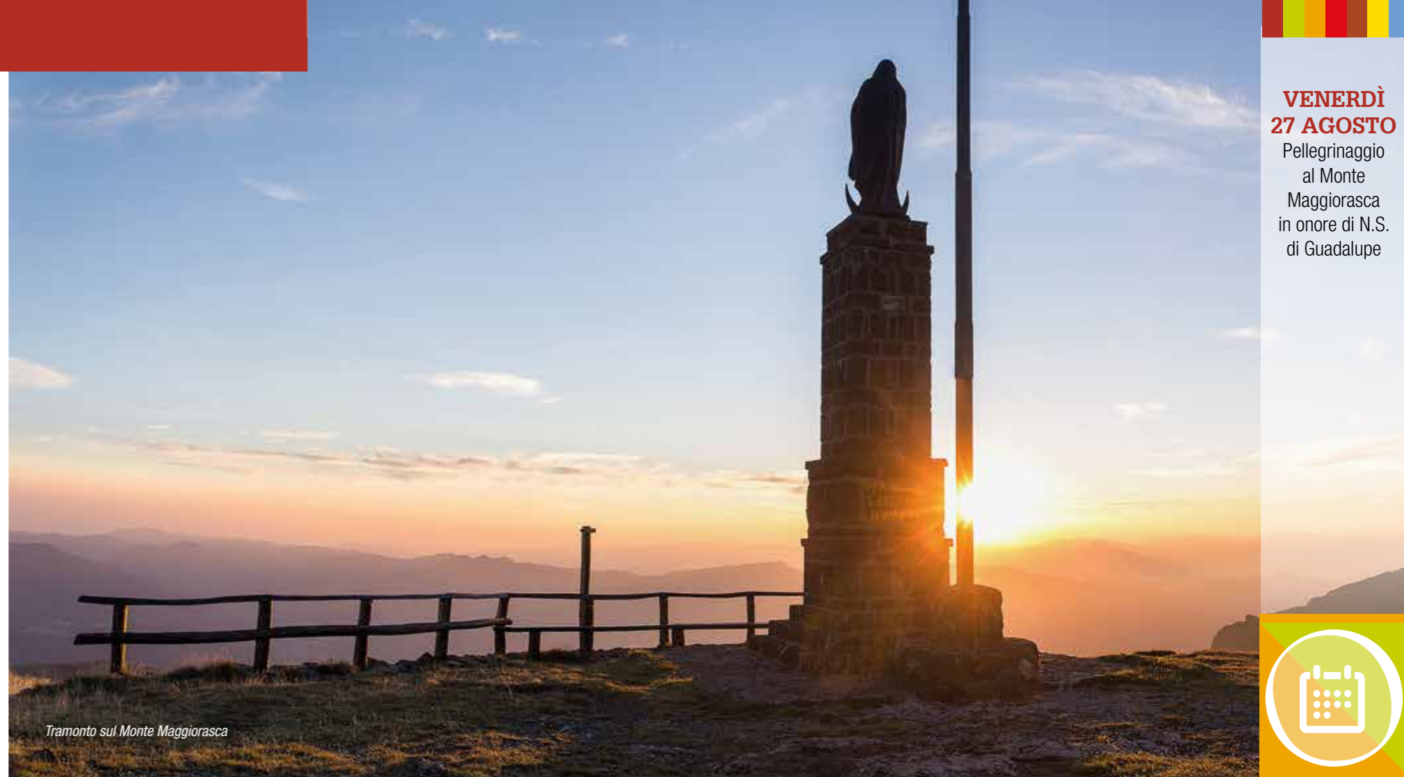
Tramonto sul Monte Maggiorasca

> Spettacolo del Circo Odeon ore 17,45 - Santo Stefano d'Aveto