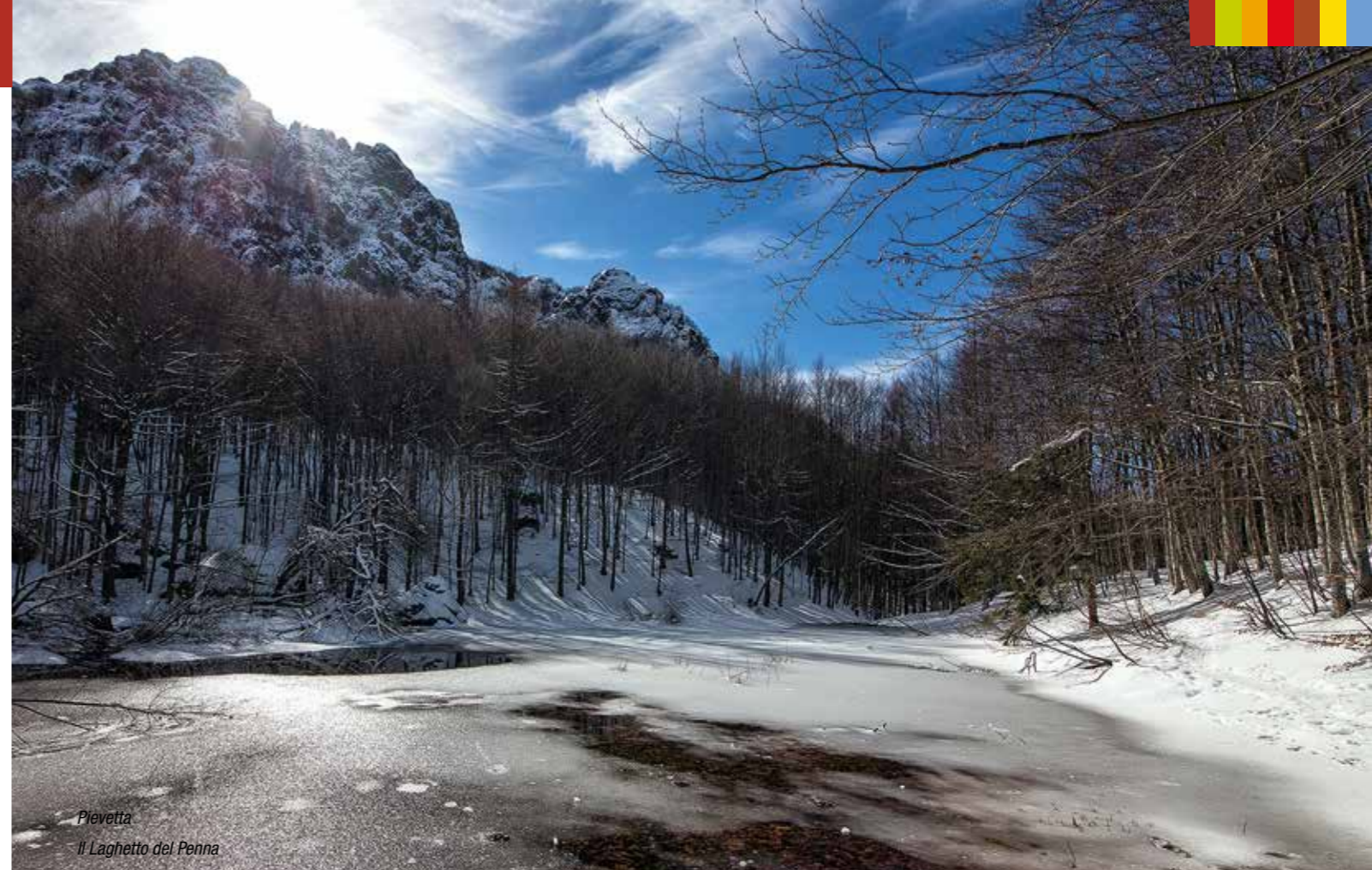
Plevetta Il Laghetto del Penna