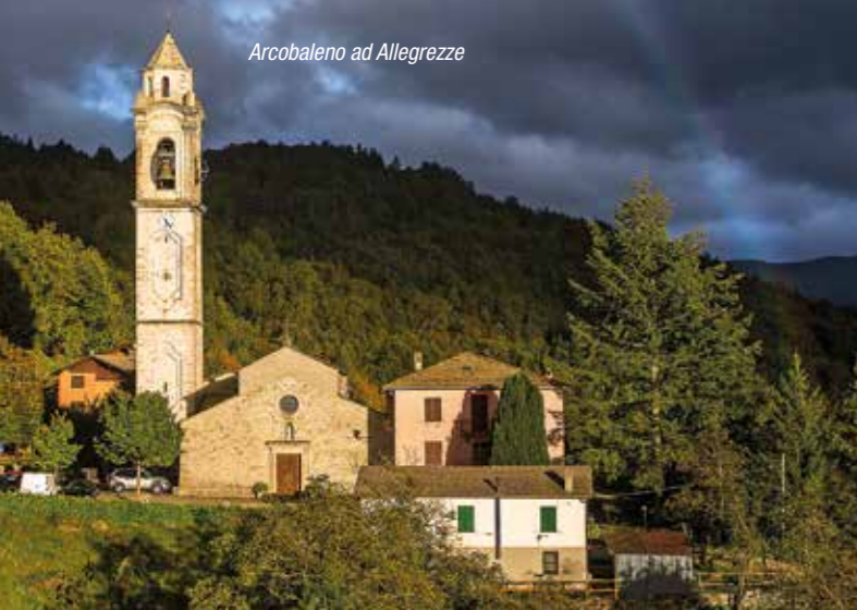
Arcobaleno ad Allegreze