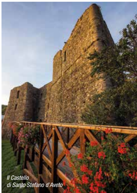
Il Castello di Santo Stefano d'Aveto

Via Albino Badinelli, 31 Cell. 3404956638